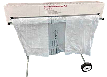
※ディスベンサー別売り