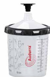
オーデュラ® DPS 650ml Set